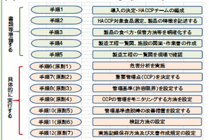
図1: HACCPは12の手順と7原則

より管理し、製品の安全性を確保しようとするものです。図1のように5つの手順と7つの原則からなっています。